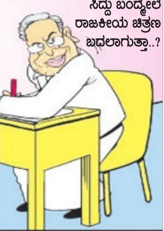
ನಿಧು ಬಂದ್ವೇಲೆ ರಾಜಕೀಯ ಚಿತ್ರಣ ಬದಲಾಗುತ್ತಾ..?