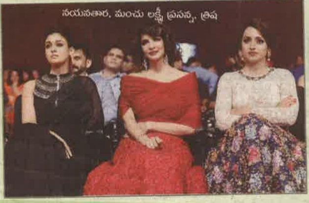
నయనతార, మంచు లక్ష్మీ ప్రసన్న, త్రిష