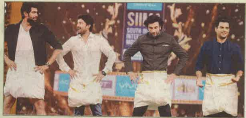
రానా, నాని, రణ్ బీర్ కపూర్, మాధవన్